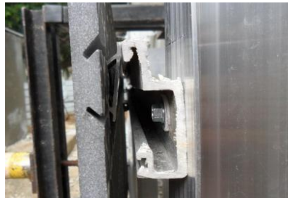
עמוד 3 מתוך 4 עמודים